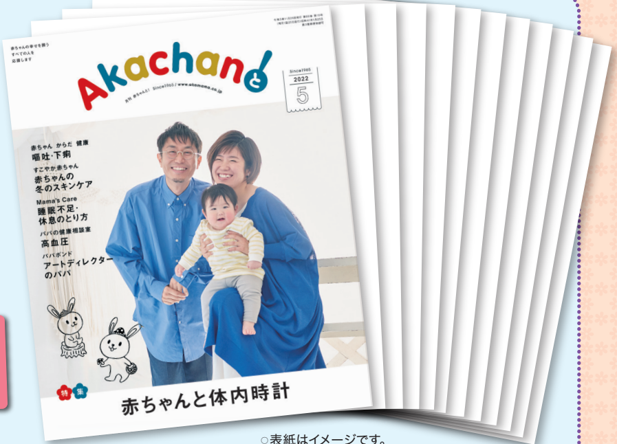
○表紙はイメージです。